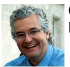
CONFÉRENCE-DÉBAT ANIMÉE PAR MARC CHAMOREL, Directeur de la rédaction de Reprendre & Transmettre magazine